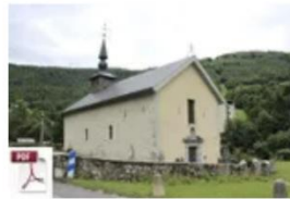
Document imprimable reprenant cette page