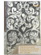
Etude stratigraphique des décors peints page